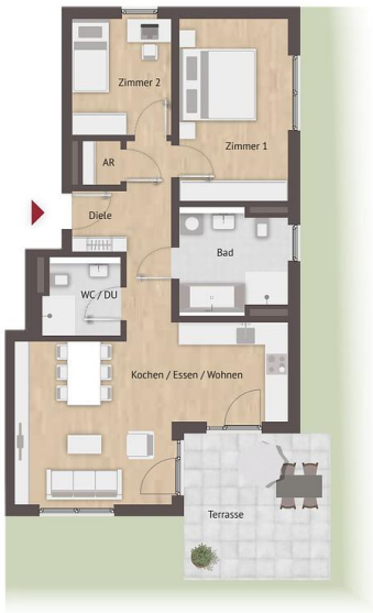
Grundriss-Illustration zur Maßentnahme nicht geeignet. Abbildung kann von endgültiger Bauausführung abweichen.