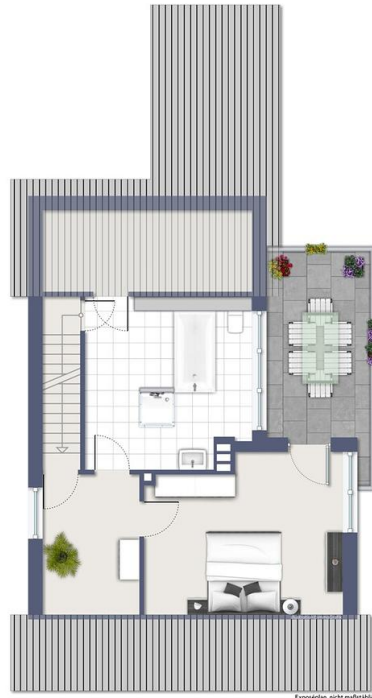
1. Obergeschoss, nicht maßstäblich