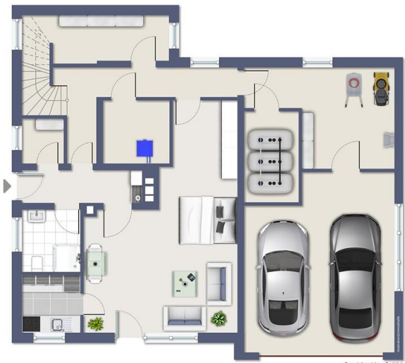
2. Obergeschoss, nicht maßstäblich