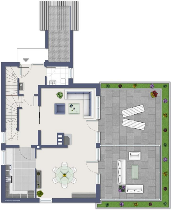
Erdgeschoss, nicht maßstäblich