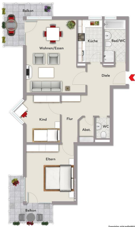
Exposiplan, nicht maßstäblich