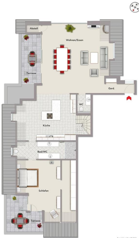
Exposéfoto, nicht maßstäblich