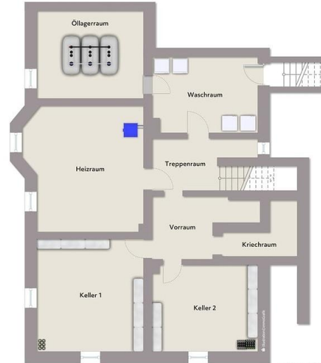
Exposierplan, nicht maßstäblich