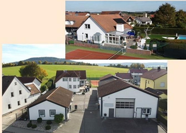
Freystadt – Forchheim

Vielseitiges Unternehmer-Anwesen in Bestzustand Wohnen. Arbeiten. Leben