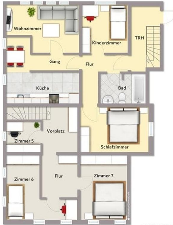
Exposiplan, nicht maßstäblich