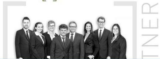
Kirsch & Häubner Immobilien, Neumarkt „Sie entscheiden – wir kümmern uns um den Rest!“