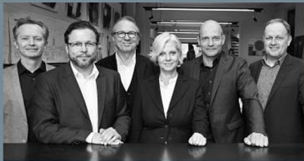
Berschneider + Berschneider, Architekten BDA + Innenarchitekten „Anspruchsvolle Architektur aus einem Guss.“

Wir verwandeln Träume in Bauwerke – durch Planung, Inspiration, Handwerk und Know-how – und sind Ihr zuverlässiger Partner.