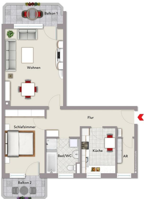
Exposiplan, nicht maßstäblich