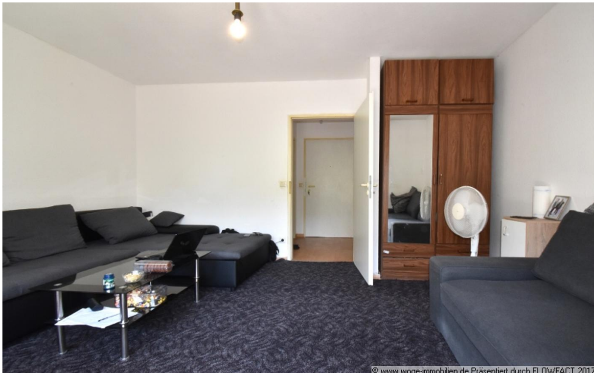
Präsentiert durch FLOWFACT 2017