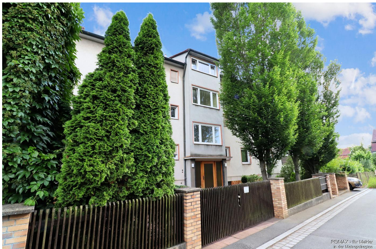
RE/MAX - Ihr Makler in der Metropolregion