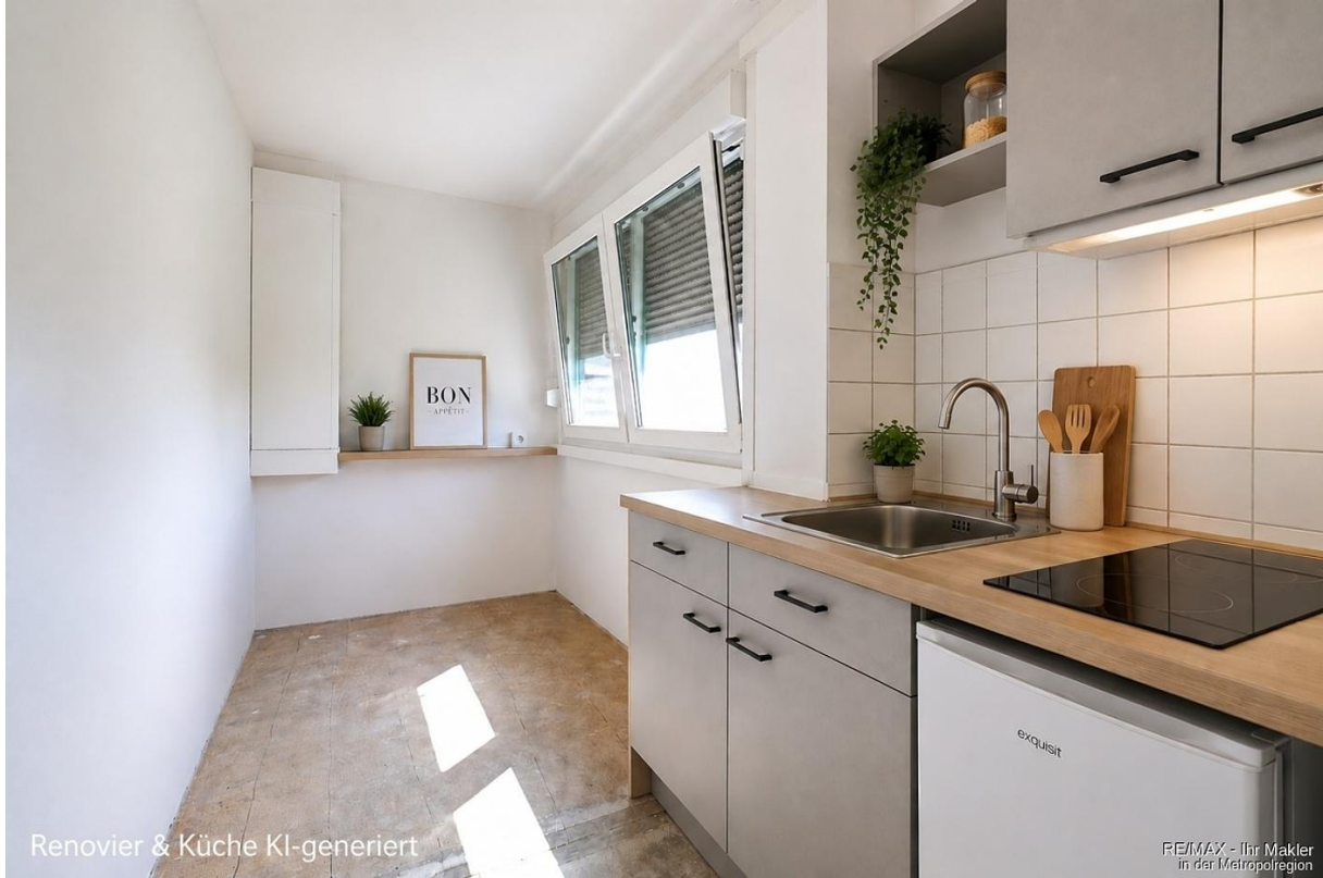
Renovier & Küche KI-generiert

REMAX - Ihr Makler in der Metropolregion