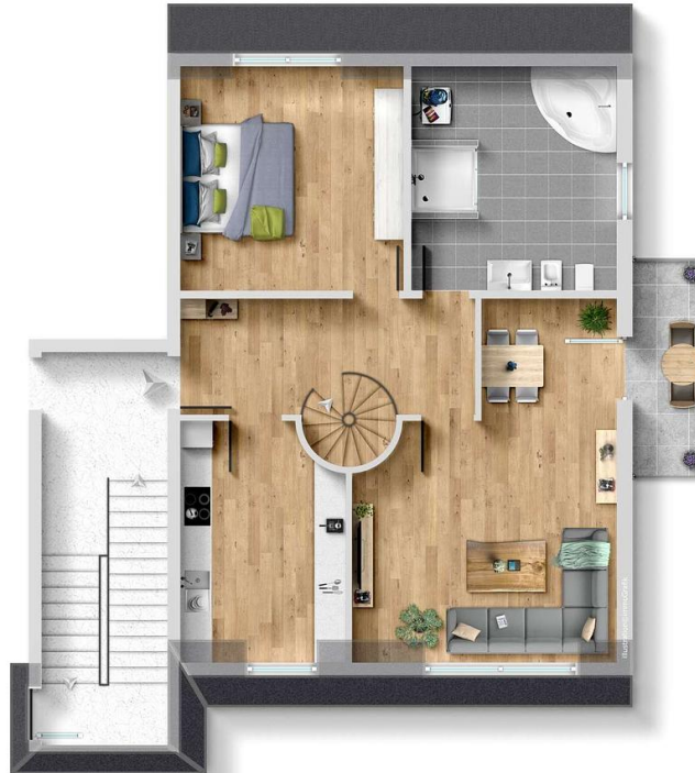
Exposplan, nicht maßstäblich