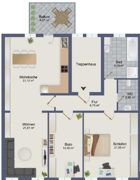
© Die Kluge Immobilien GmbH - Immodat GmbH. Präsentiert durch Performer CRM