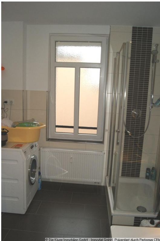
Präsentiert durch Performer CRM