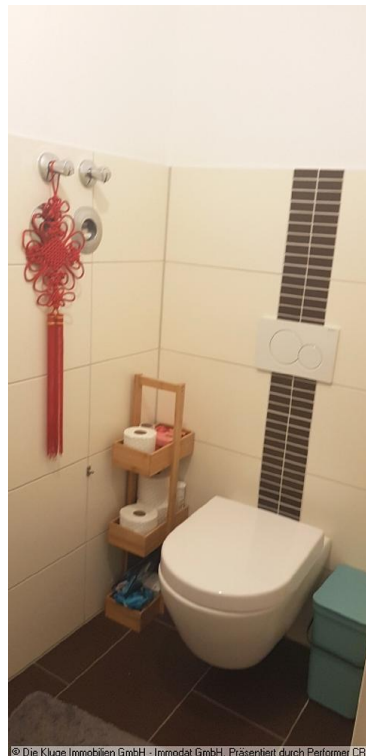
© Die Kluge Immobilien GmbH - Immodat GmbH. Präsentiert durch Performer CRM