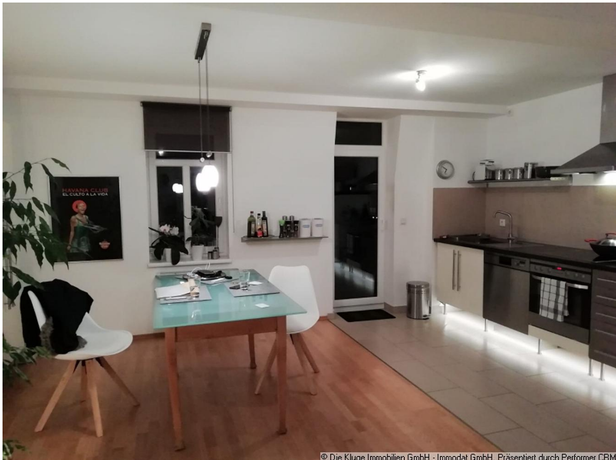
© Die Kluge Immobilien GmbH - Immodat GmbH. Präsentiert durch Performer CRM