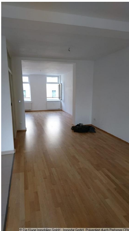
© Die Kluge Immobilien GmbH - Immodat GmbH. Präsentiert durch Performer CRM