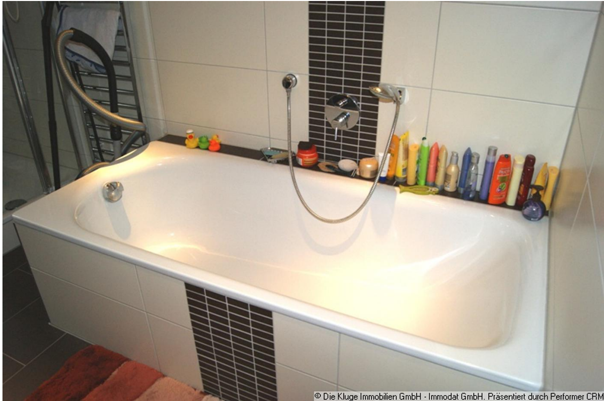
© Die Kluge Immobilien GmbH - Immodat GmbH. Präsentiert durch Performer CRM