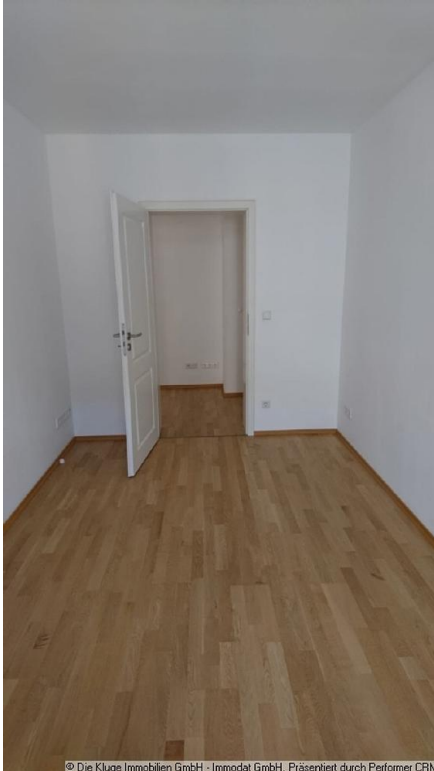
© Die Kluge Immobilien GmbH - Immodat GmbH, Präsentiert durch Performer CRM