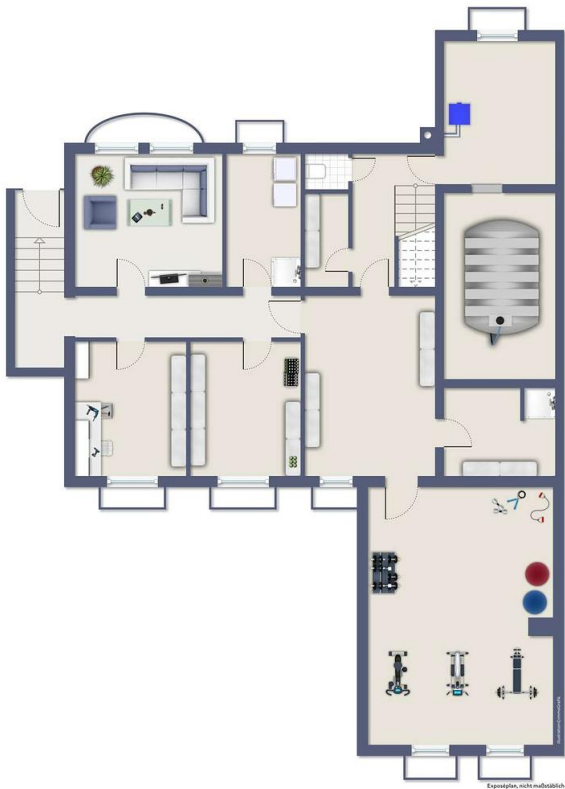
Exposplan, nicht maßstäblich