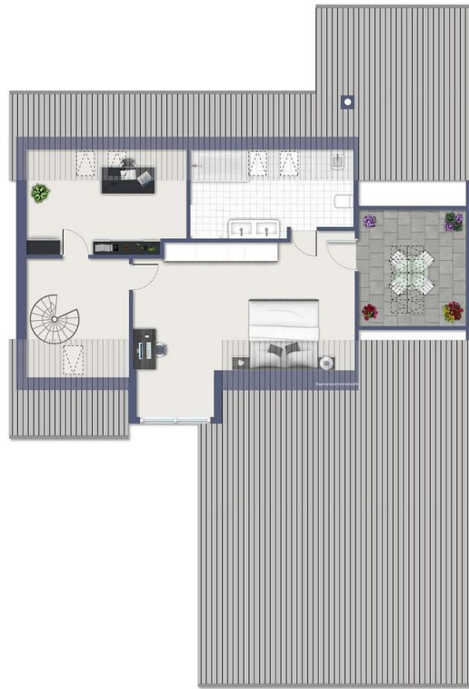
Exposplan, nicht maßstäblich