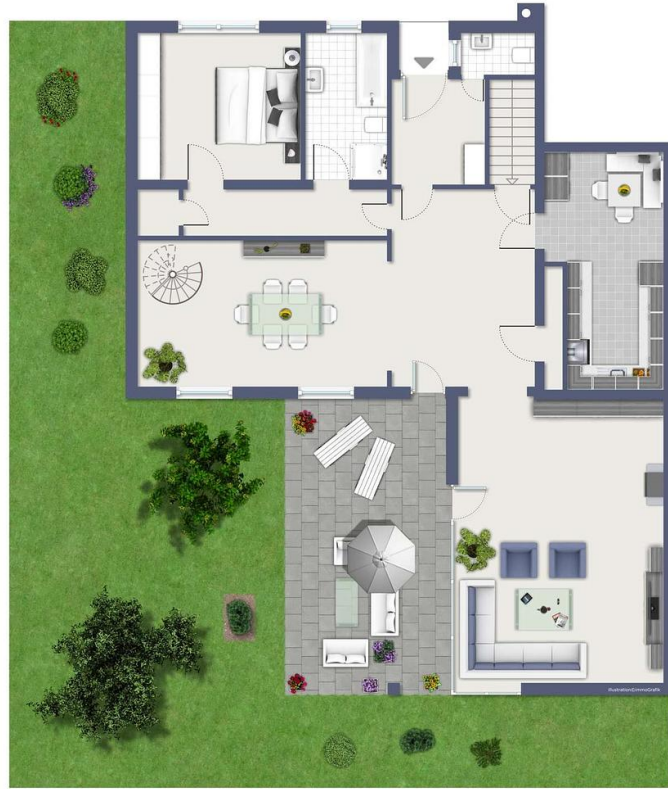
Exposplan, nicht maßstäblich