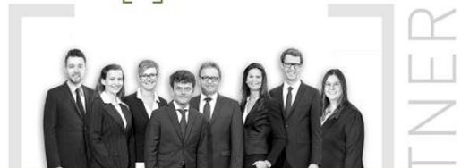
Kirsch & Haubner Immobilien, Neumarkt „Sie entscheiden – wir kümmern uns um den Rest!“