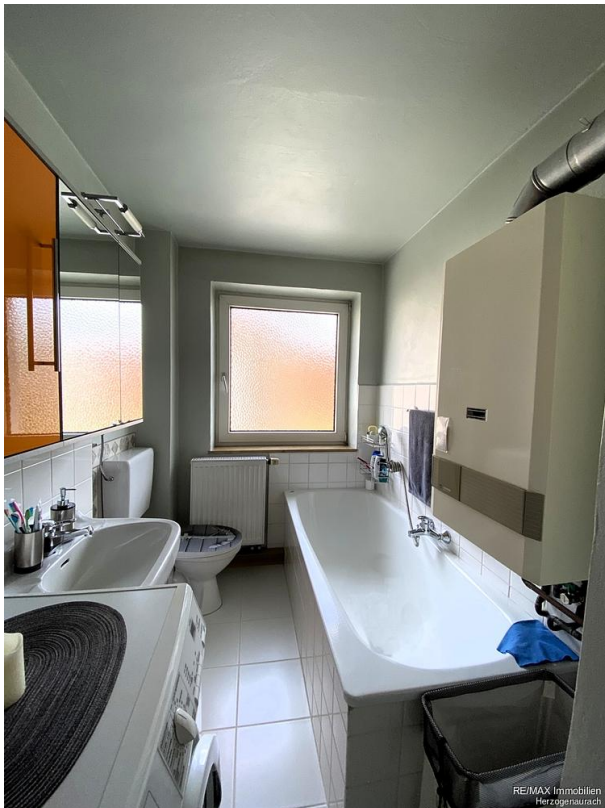
RE/MAX Immobilien Herzogenaurach