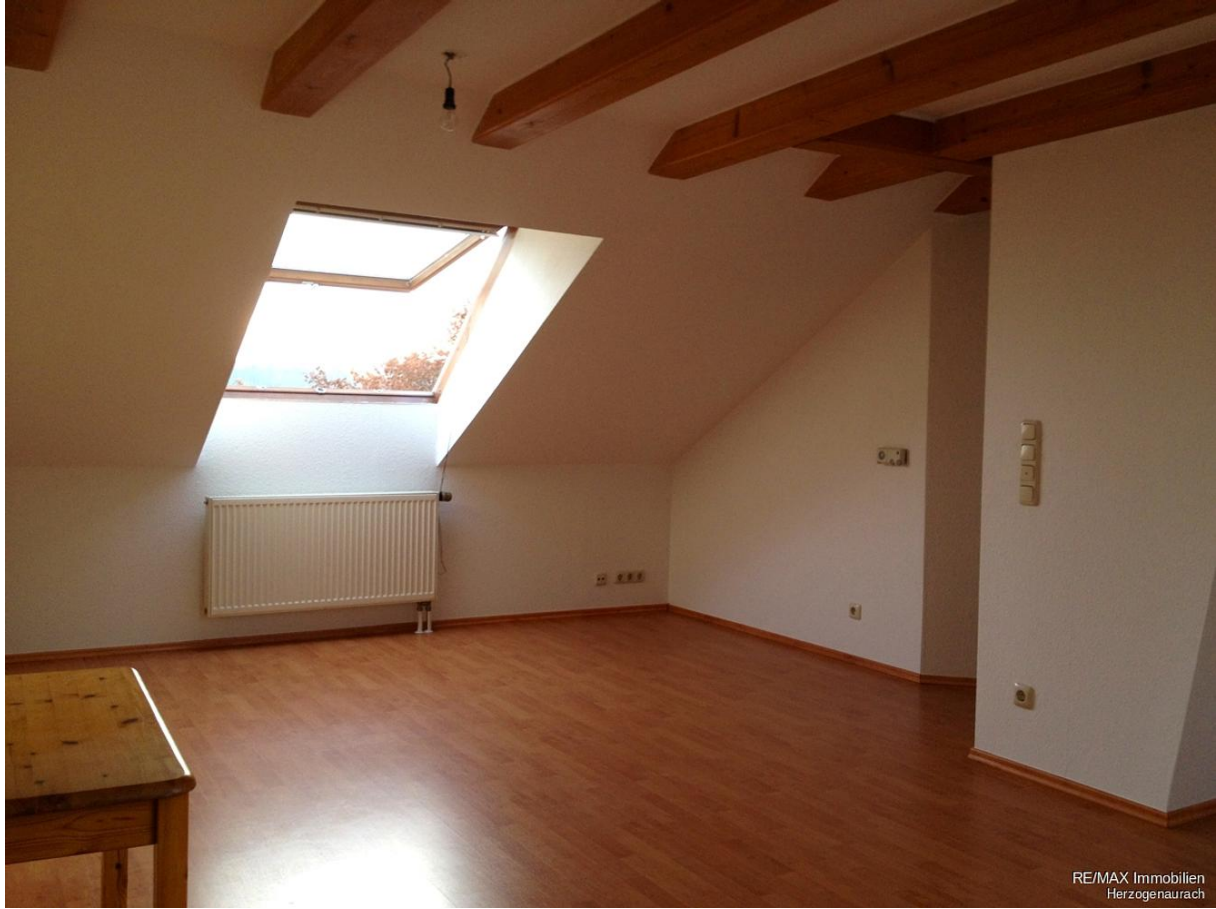
RE/MAX Immobilien Herzogenaurach