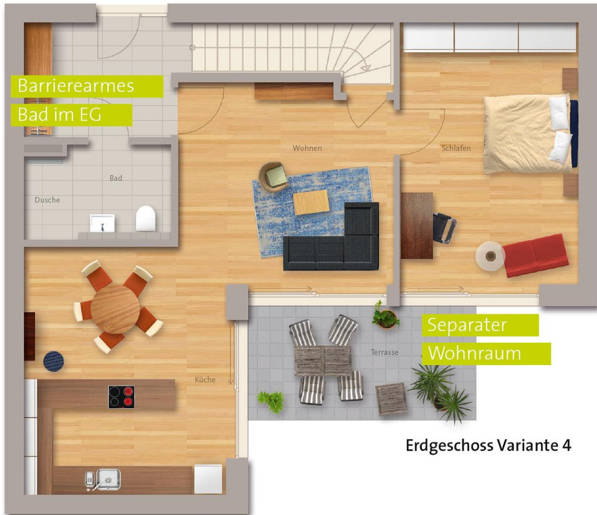
Erdgeschoss Variante 4