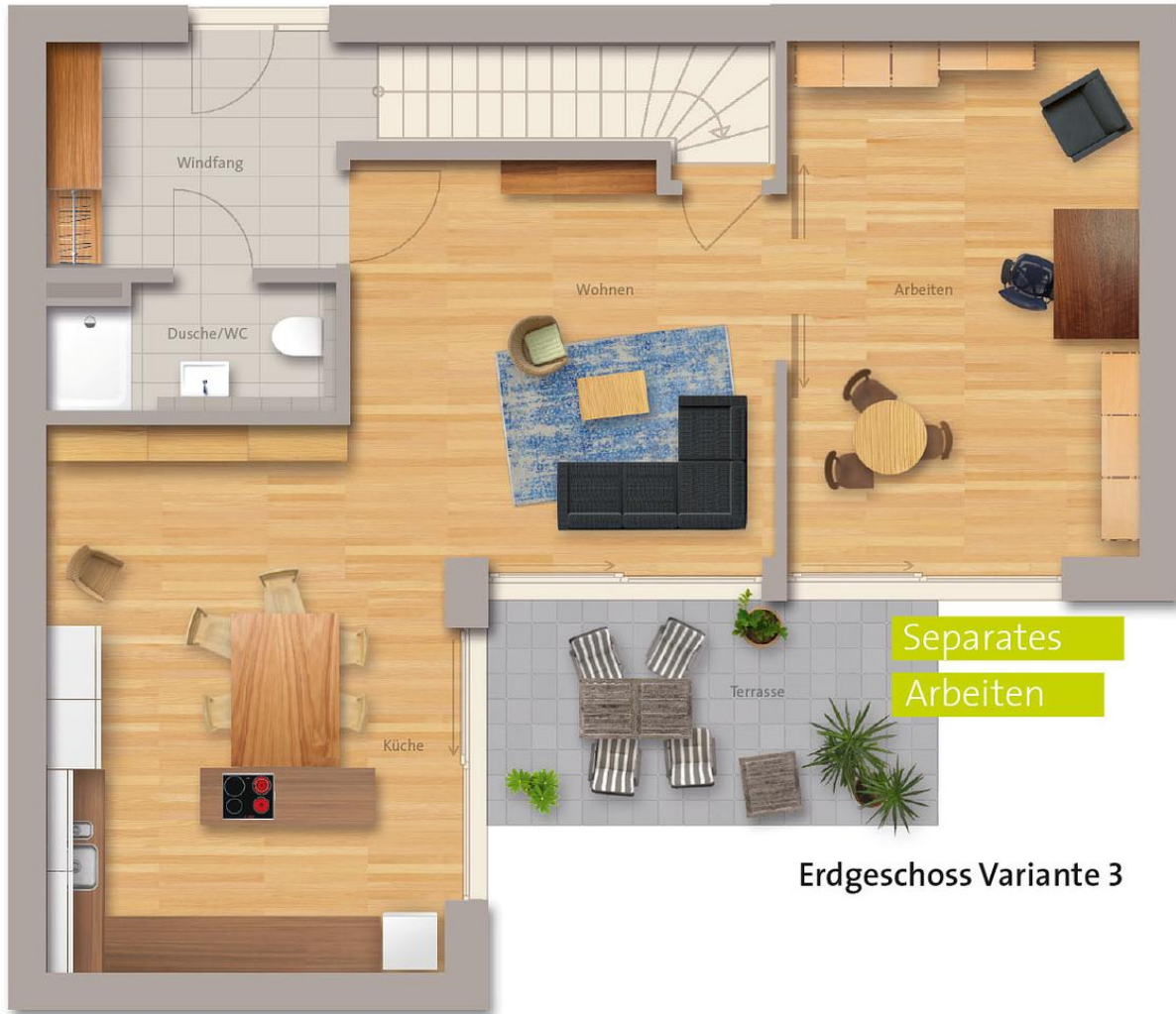
Erdgeschoss Variante 3