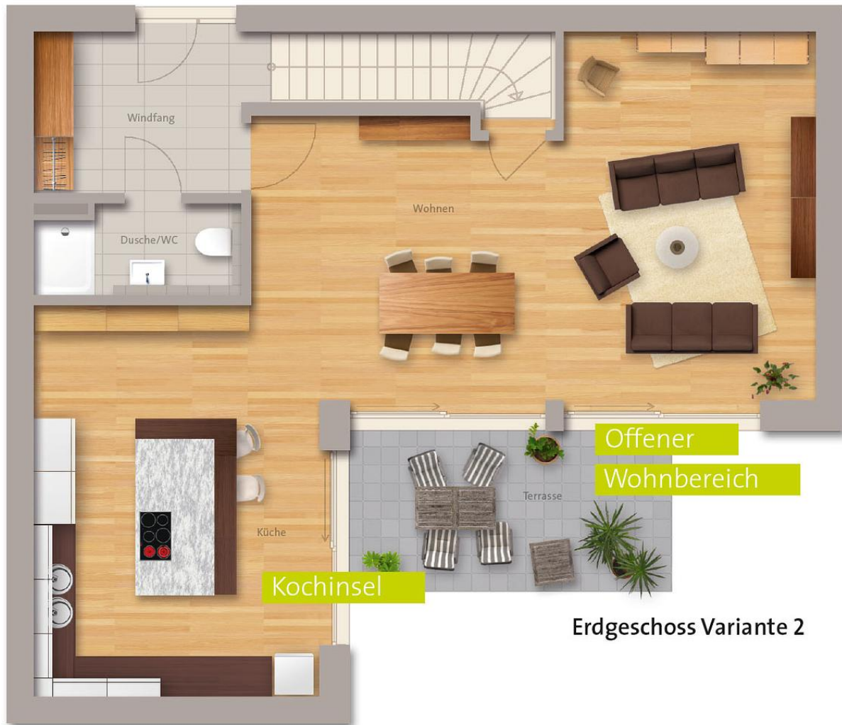
Erdgeschoss Variante 2