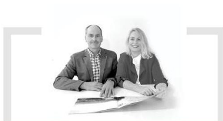
Weidinger Wohnbau, Bauunternehmen, Deining „Sicherheit und kompromisslose Qualität.“