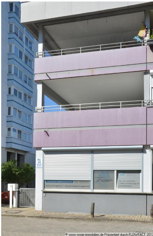
© www.woge-immobilien.de Präsentiert durch FLOWFACT 2017