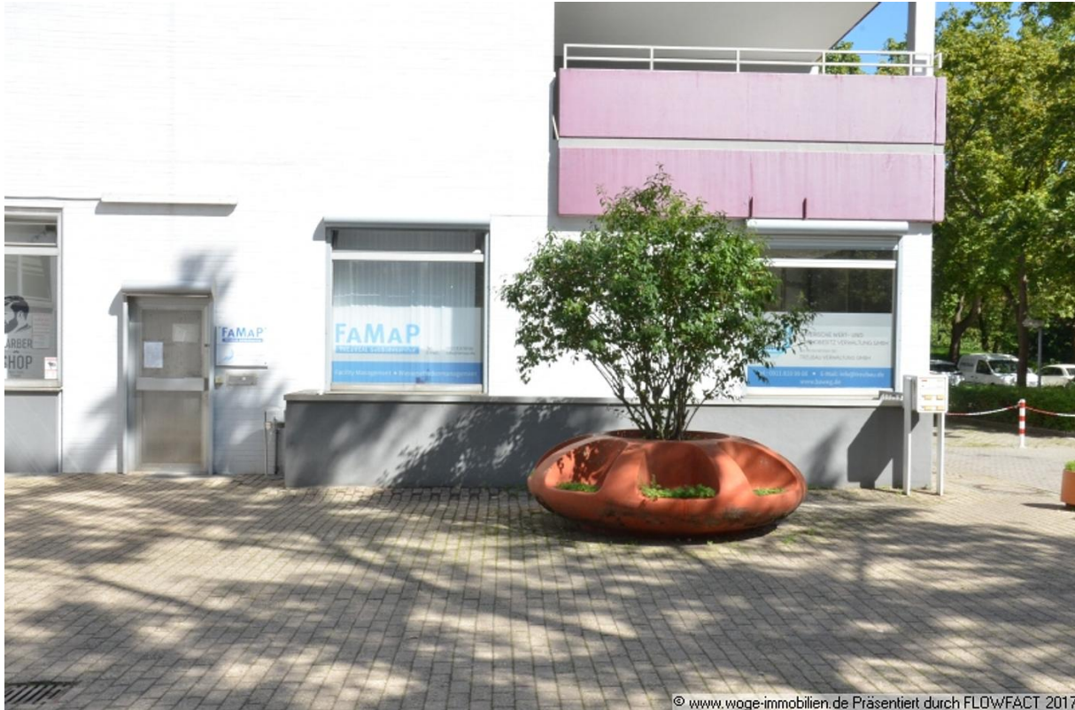
© www.woge-immobilien.de Präsentiert durch FLOWFACT 2017