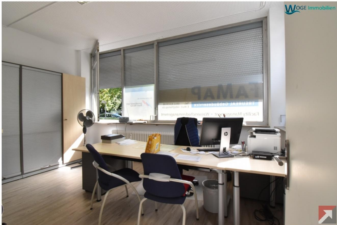
© www.woge-immobilien.de Präsentiert durch FlowFact 2017