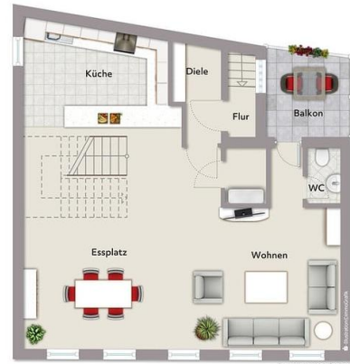
Exemplarplan, nicht maßstäblich