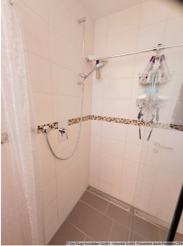
© Die Kluge Immobilien GmbH - Immodat GmbH. Präsentiert durch Perfumei CRM