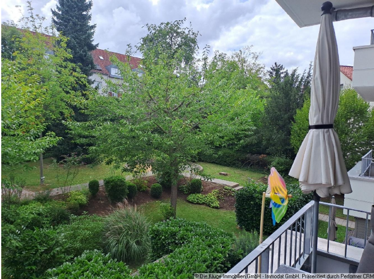
© Die Kluge Immobilien GmbH - Immodat GmbH. Präsentiert durch Performer CRM