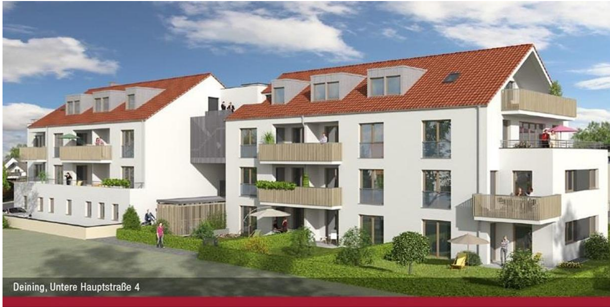
Deining, Untere Hauptstraße 4